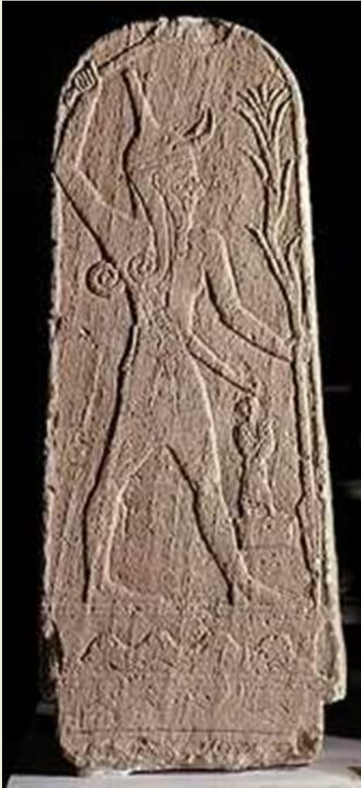
Baal Storm God